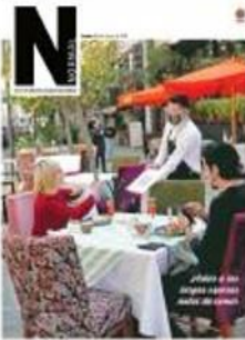
BUSCA EN INTERIORES SUPLEMENTO NORMAL